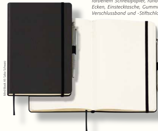
Mind-Book A5 Salsa Schwarz

Legendäres Notizbuch. Mit cremefarbenem Schreibpapier, runden Ecken, Einstecktasche, Gummiverschlussband und -Stiftschlaufe.