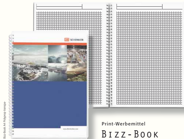
Bizz-Book A4 Polyprop transparent